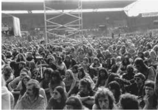
Olympisch Stadion, Amsterdam 22 mei 1972