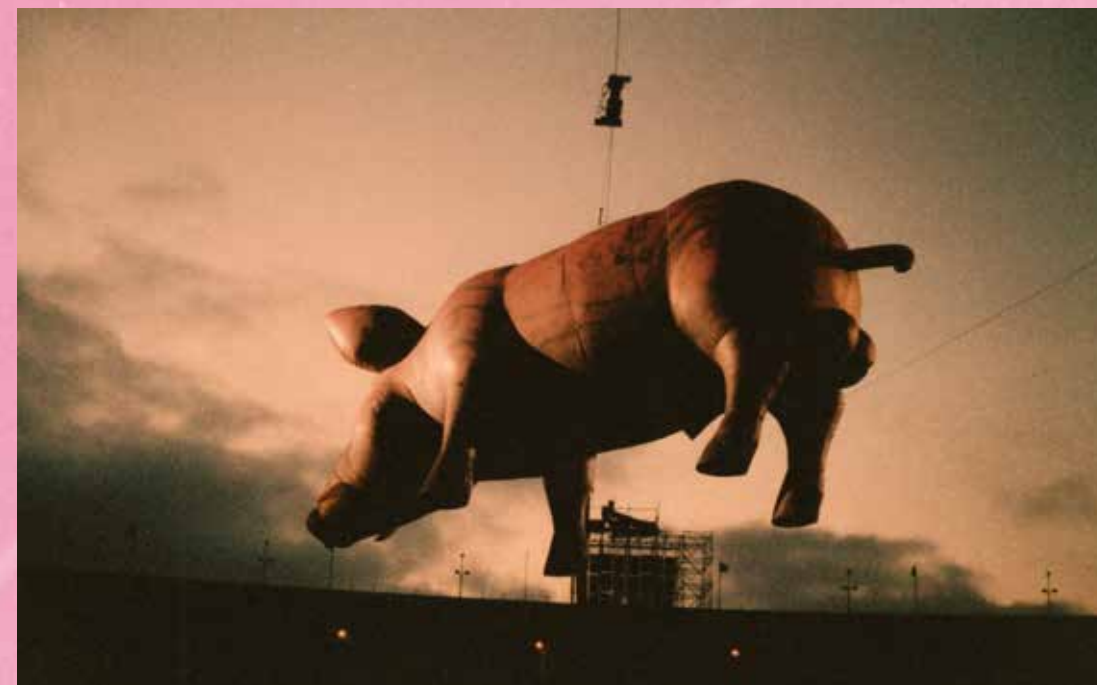
Stadion Feyenoord, Rotterdam 14 juni 1988

Als Pink Floyd na een tweede Amerikaanse tournee begin juni in Europa arriveert, is Rotterdam – na een concert in het Franse Nantes – de tweede halte. Pink Floyd krijgt van de gemeente toestemming om tot twaalf uur ’s nachts door te gaan, zodat het concert pas om negen uur hoeft te beginnen. Op deze manier komt de show van Pink Floyd, vooral in visueel opzicht, optimaal uit de verf. Terwijl quadrafonische geluidjes door de speakers klinken, vliegen er bij wijze van opening twee ro(n)kende replica’s van Spitfire straaljagers over het Rotterdamse stadion. De vliegtuigjes worden bestuurd door twee piloten die Mason en Gilmour hebben leren kennen tijdens hun eigen vlieglessen. Het geluid van de vliegtuigmotoren wordt overgenomen en vormt een intro voor het openingsnummer Shine On You Crazy Diamond . Wat volgt is een selectie uit A Momentary Lapse Of Reason met Learning To Fly , Yet Another Movie en Round And Around . Vanwege de tijdslimiet wordt er bij enkele concerten van de tour gesneden in de eerste helft. Hierdoor vervallen bijvoorbeeld in Rotterdam de nummers A New Machine Part 1 , Terminal Frost en A New Machine Part 2 . In plaats daarvan gaat het concert verder met Sorrow en The Dogs Of War . On The Turning Away is het slotakkoord van het eerste deel. Fans van groepen met zulk een historie als Pink Floyd komen zelden naar de concerten om hoofdzakelijk