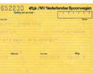
Stadion Feyenoord, Rotterdam 14 juni 1988