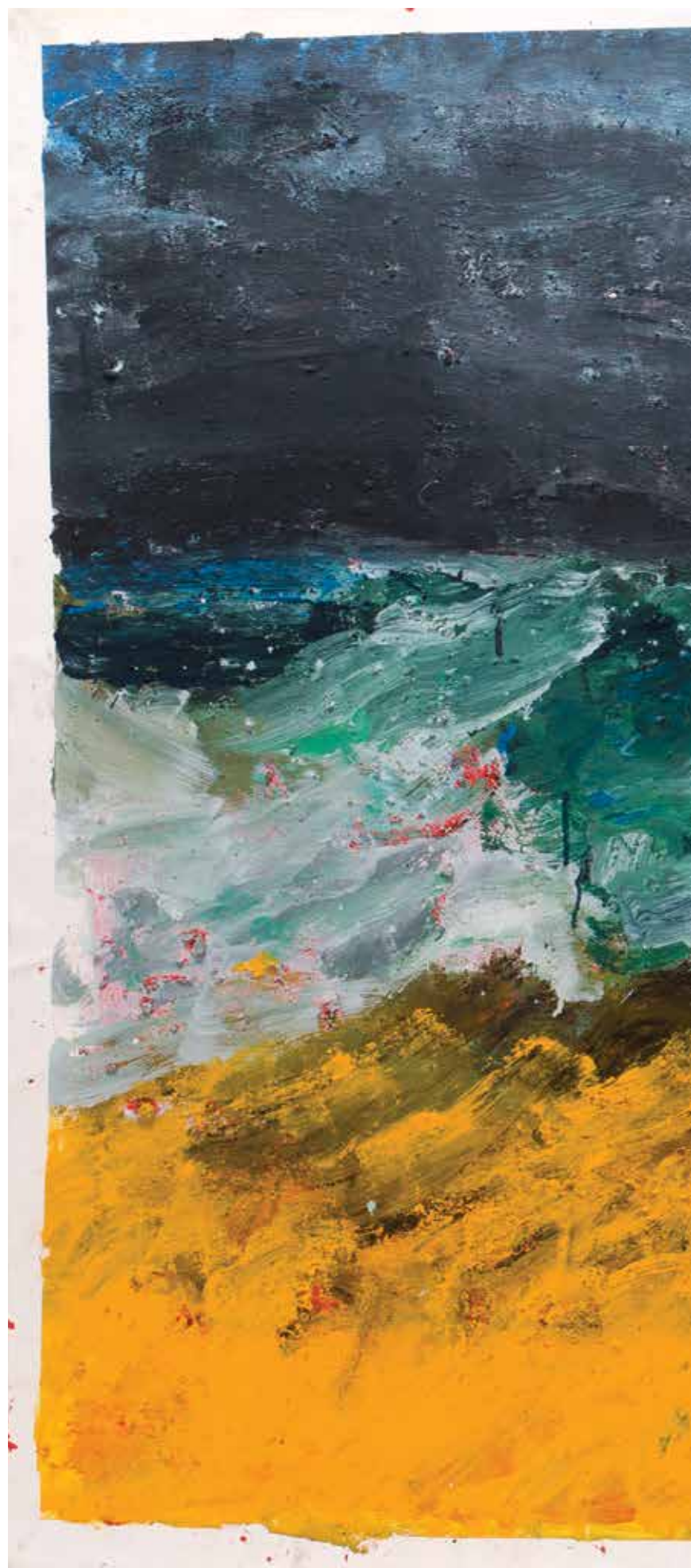
Wellfleet 2014 olieverf op papier 120 × 150 cm