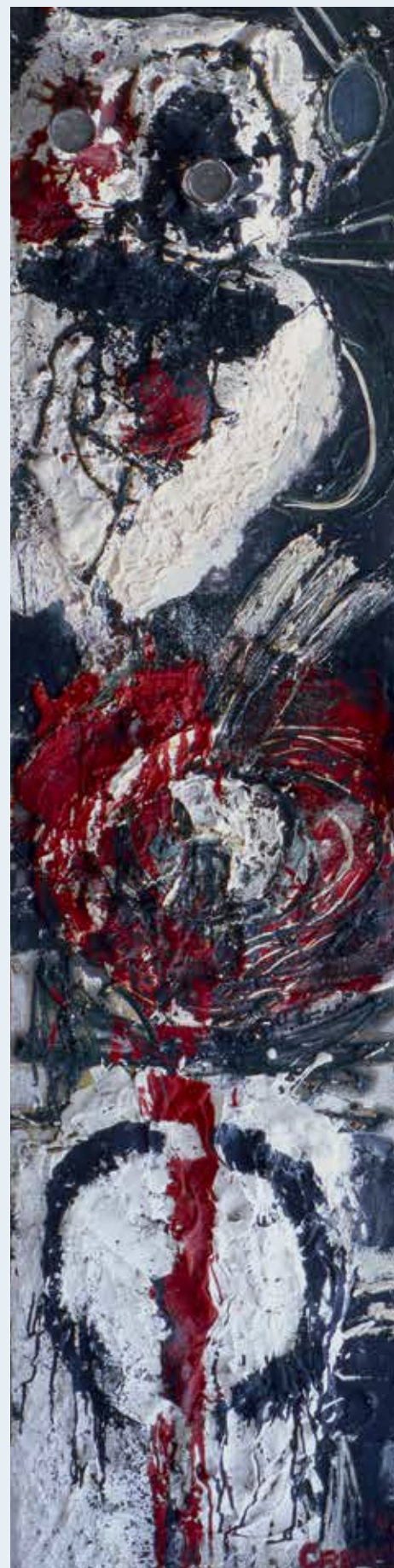
Scherschutter 1958 olieverf op paneel, 200 × 50 cm