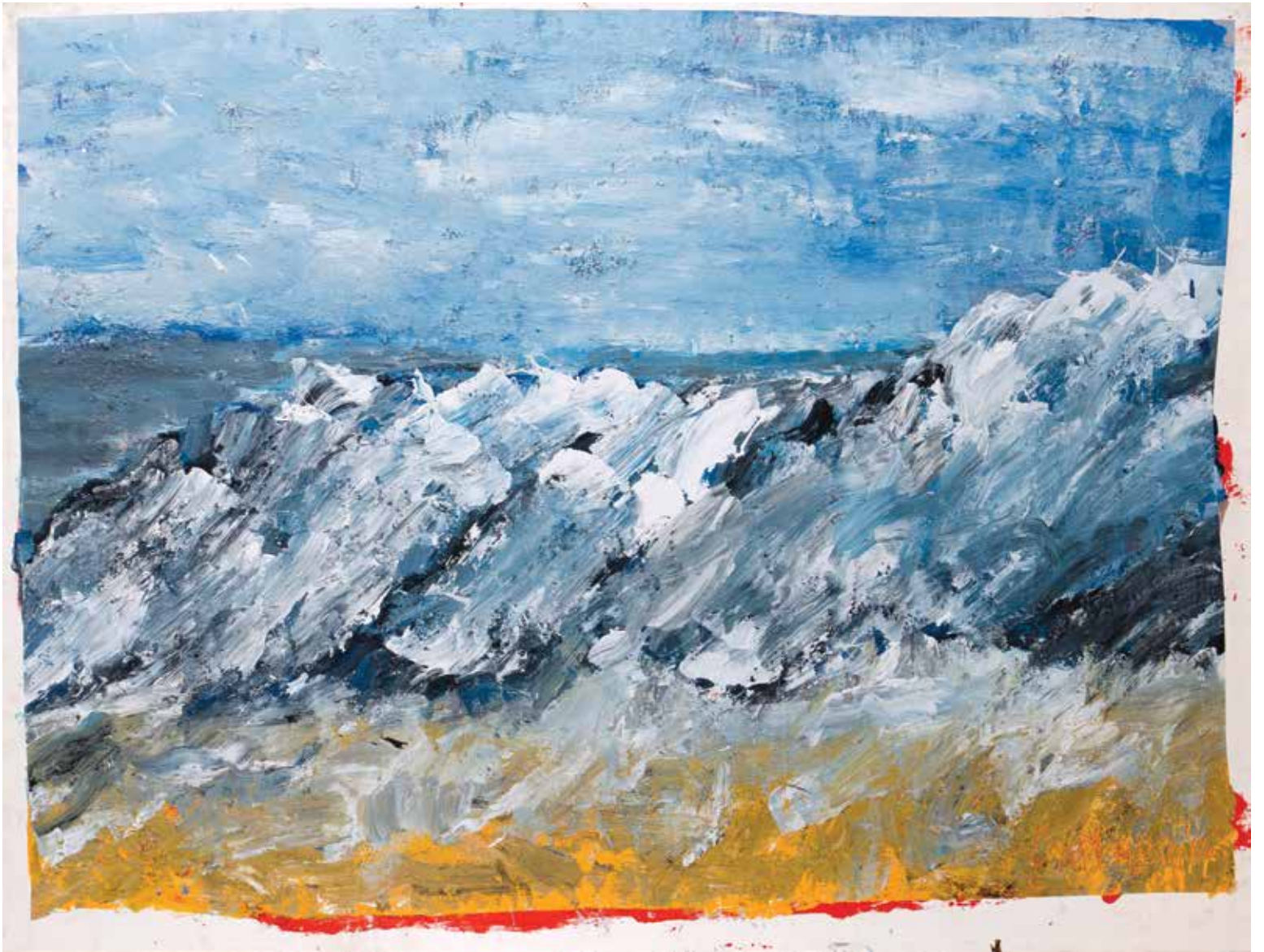
Cape Cod Seashore 2014 olieverf op papier 120 × 150 cm