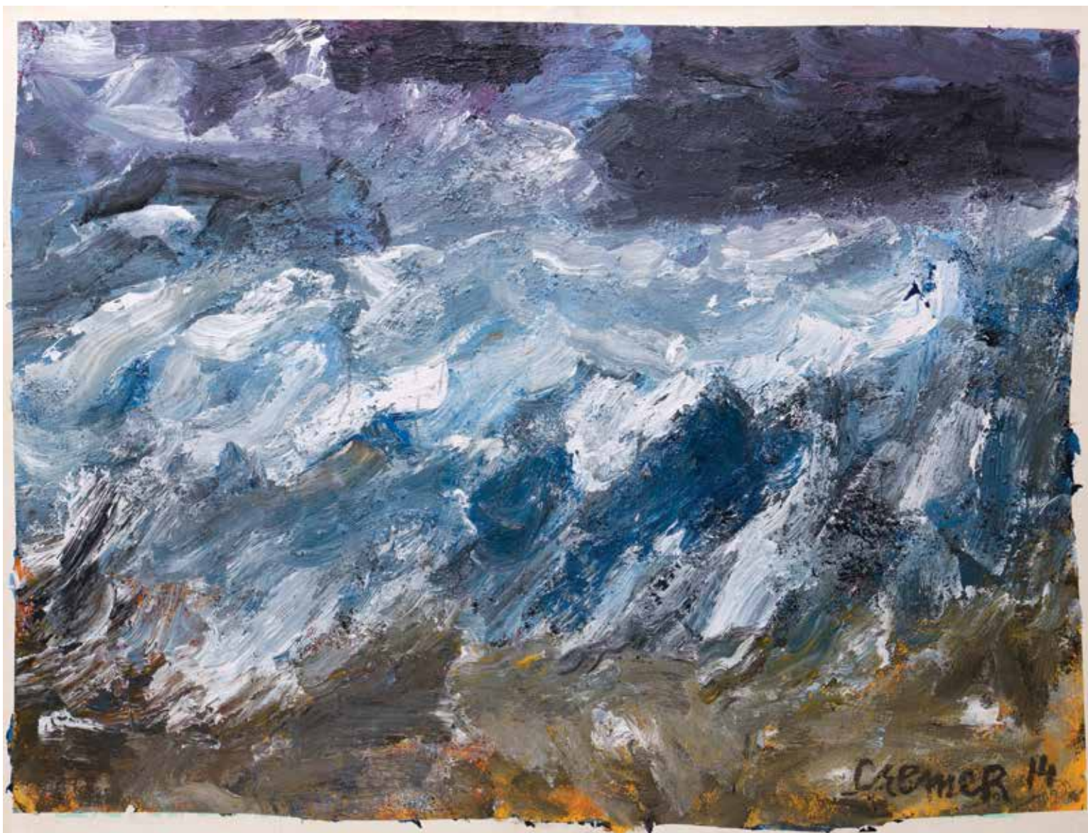
Finse Golf 2014 olieverf op papier 120 × 150 cm