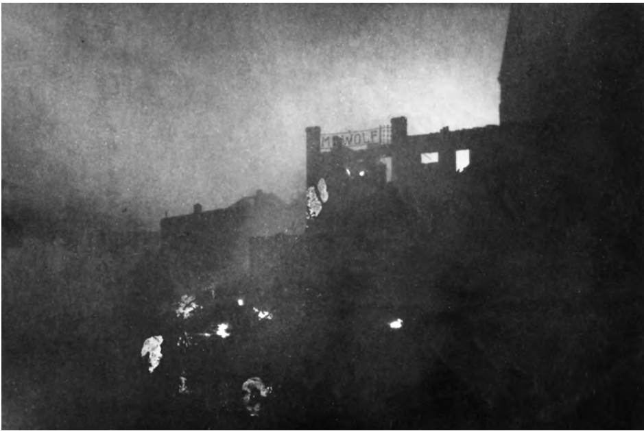
De vuurzee rond de daktekst 'M.B. Wolf'