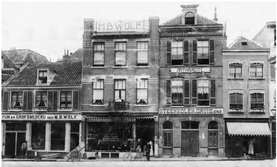
Ziekerstraat 7-9, met de tekst 'M.B. Wolf' op het dak

Nijmeegse oorlogsdocumentatie in een schoenendoos. Aan de hand daarvan heeft ze haar kleinkinderen altijd veel over die tragische periode verteld.