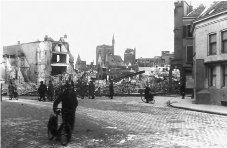
De restanten van de winkels met bovenwoningen aan de Ziekerstraat

die hun verontrusting over de ontwikkelingen op de begraafplaats kenbaar maakten. Eén gesprek zou me altijd bijblijven.