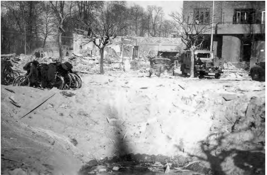
Kronenburgersingel 8 - 10 voor en na het bombardement