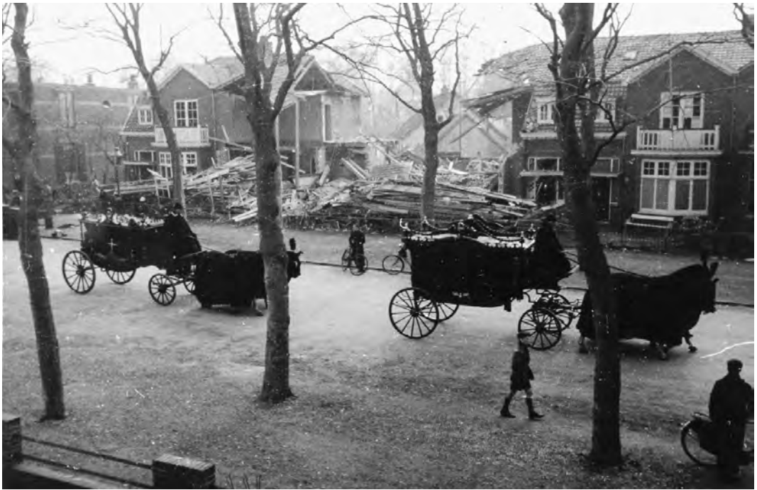
Op 30 maart 1942 passeerden de drie rouwkoetsen de verwoeste huizen op weg naar de Lourdeskerk, waar de uitvaart plaatsvond