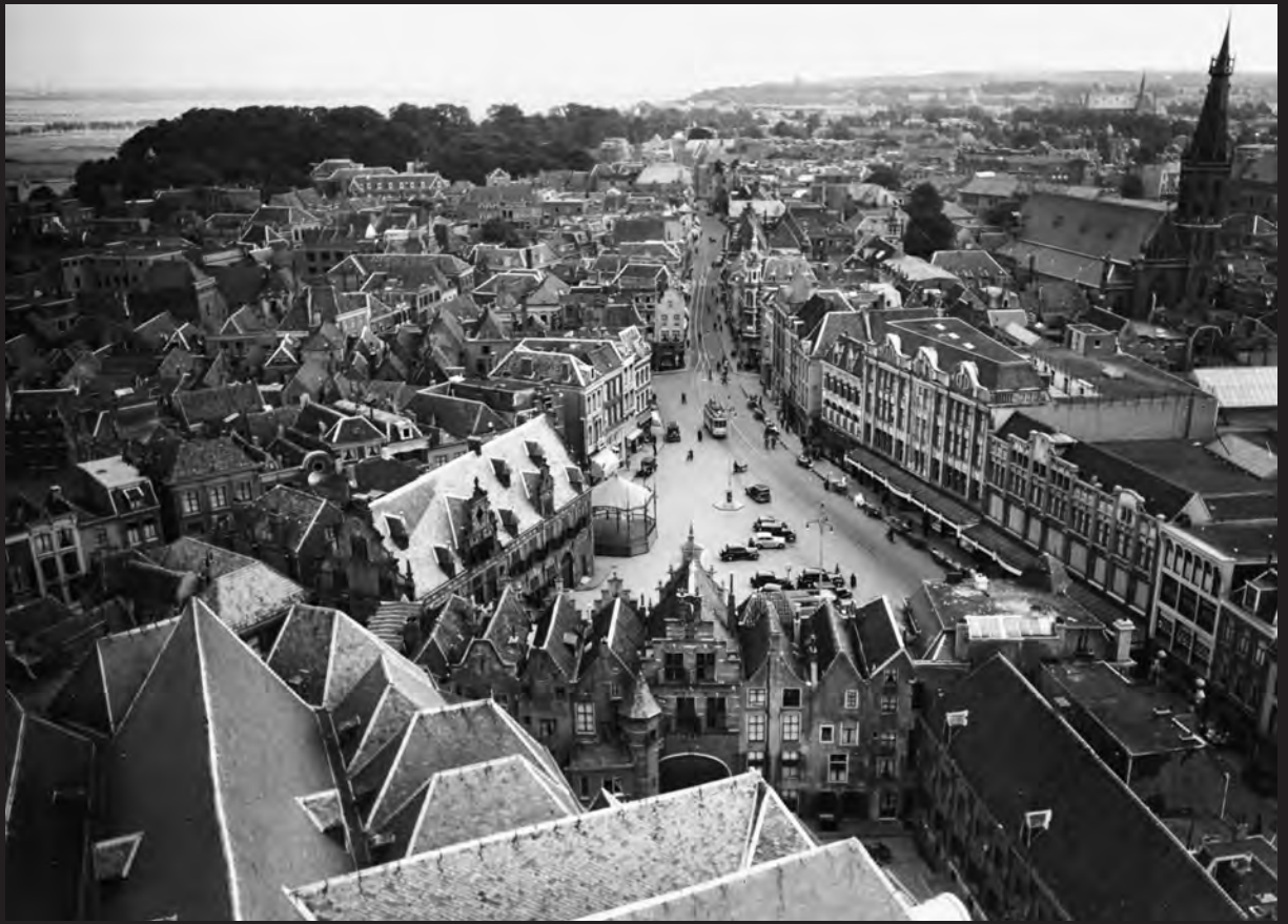
De binnenstad van Nijmegen gezien vanaf de St. Stevenstoren, eind jaren 1930