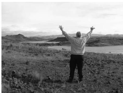
Afb. 4: Terug bij Sillustani in 2012, een herbeleving van wat 25 jaar eerder was gebeurd.