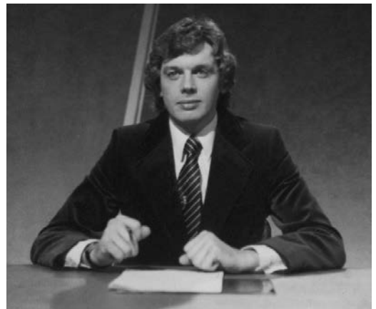
Afb. 1: Op weg naar geestelijke gezondheid.