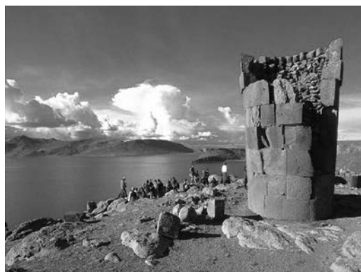
Afb. 3: Het prachtige Sillustani.