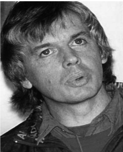
Afb. 5: In andere sferen in 1990 – maar essentieel voor het vervolg.

mensen zien ontwaken, die zich realiseren dat de wereld niet is wat je denkt, en niet is zoals je verteld wordt door regeringsinstellingen en overheidsinstututen. Ik heb inmiddels een lange lijst boeken geschreven en ik spreek voor duizenden mensen per keer bij evenementen over de hele wereld, informatie delend die ik via allerlei synchroniciteiten in mijn leven heb verzameld over een veelzijdigheid aan onderling verbonden onderwerpen. Allerlei onderwerpen zijn op zichzelf al interessant, maar ze met elkaar verbinden heeft een extra groot effect door de inzichten die eruit volgen. De synchroniciteiten in de eerste jaren na Betty Shine en Peru hebben