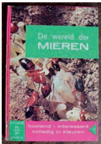
Mijn eerste boekje over leven en werk van de mieren.

om de zwarte wegmieren te volgen. Door al dat kruipen over de ruwe stenen vormde zich op mijn knie  n een dikke eeltlaag. Mijn moeder ergerde zich soms aan wat ze plagend mijn olifantenknie  n noemde. Toen ik zes of zeven jaar oud was, kreeg ik een boekje over het leven en