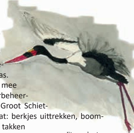
Eigen tekening van de zadelbekooievaar.

leuk vond om veel van de anderen te leren en om samen dingen te doen. Maar ik vond alles interessant en wilde graag van vele dingen iets weten. Niet alleen specifiek over een bepaalde groep planten of vogels, maar ook over het geheel en over de onderlinge relaties tussen al die planten en dieren en hun leefgebied. Soms be kroop me het gevoel dat de natuurliefhebberij wat elitair was. Iets voor specialisten, waarvan de gewone mensen toch weinig kaas hadden gegeten. Ik wist al snel dat ik geen echte specialist wilde zijn. Ik wilde iets doen met de kennis die ik mondjesmaat verzamelde. Toen schreef ik me in voor een cursus natuurgids.