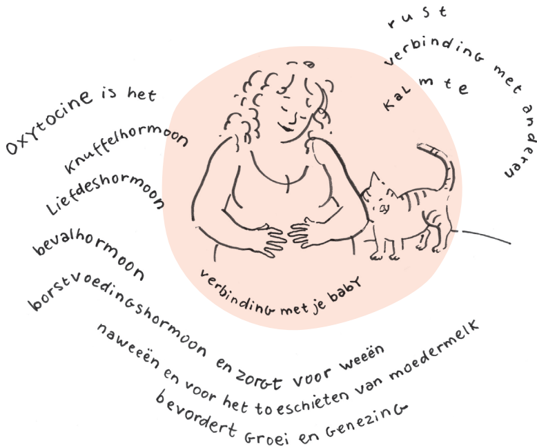
De wonderbaarlijke werking van oxytocine

Omdat het vrijkomt bij knuffelen, en zelfs bij het aaien van je huisdier of - sterker nog - als je huisdier gewoon bij jou op schoot zit, wordt het ook het knuffelhormoon genoemd. Als metafoor wordt het een verlegen hormoon genoemd; het komt voorzichtig om het hoekje kijken of alles veilig is en bij het minste signaal van onraad trekt het zich terug. 3