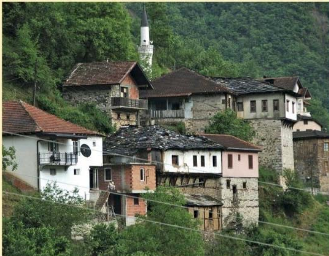
De karakteristieke huizen van het dorpje Janče

heid. Veel van die huwelijkskandidaten waren altijd op pad om tot in de verre