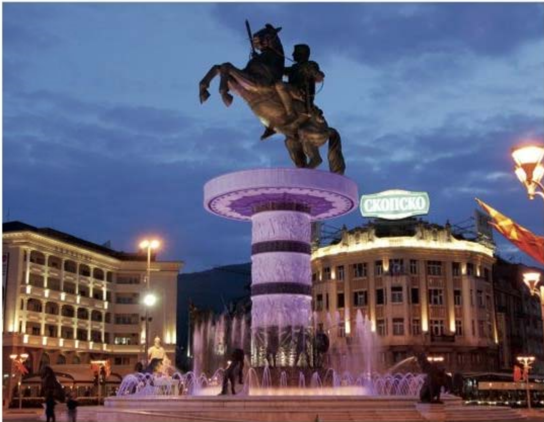
Plošad Makedonija met het standbeeld van Alexander de Grote

Markt – Zelen Bazar 2 , dag. ca. 6-ca. 16 uur. Groente, fruit en zuivel, maar ook veel non-food. De kooplieden beginnen al om 6 uur 's ochtends en houden het vaak vroeg in de middag voor gezien.