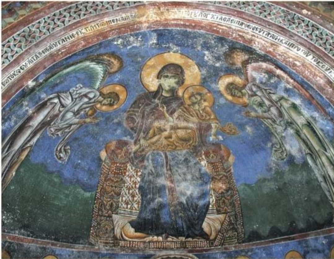
Fresco in de absis van de Sveti Gjorgi in Kurbinovo; links de aartsengel Gabriël die ook op het bankbiljet van 50 denar staat

(een soort trommel) en de harmonika (een soort accordeon). Om een indruk te krijgen van de optredens van Tanec zijn er diverse filmpjes op YouTube te zien; zie verder www.tanec.com.mk .