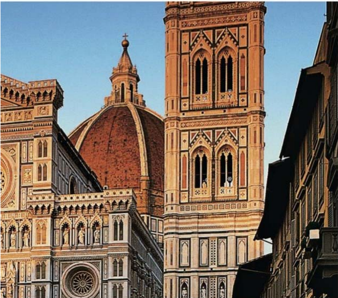
Duomo Santa Maria del Fiore met campanile en baptisterium

over een nog oudere kerk en was Dantes lievelingskerk, hij werd er ook gedoopt. Tot aan de 19e eeuw was de San Giovanni de enige doopkerk van Florence, er vond twee maal per jaar een massale doopplechtigheid plaats. Ook het baptisterium heeft een marmeren incrustatiegevel, maar de motieven zijn hier veel geometrischer dan die op de Santa Maria Novella. Dunne, witte marmerplaten uit Carrara en donkergroene uit Prato bekleeden de ruw gemetselde muren. Hoogtepunt van de kerk zijn de drie bronzen portalen, met op de eerste plaats de door Michelangelo bewonderde 'Paradijspoort' tegenover de dom. Dit fraaie werk van Lorenzo ▷ blz. 88