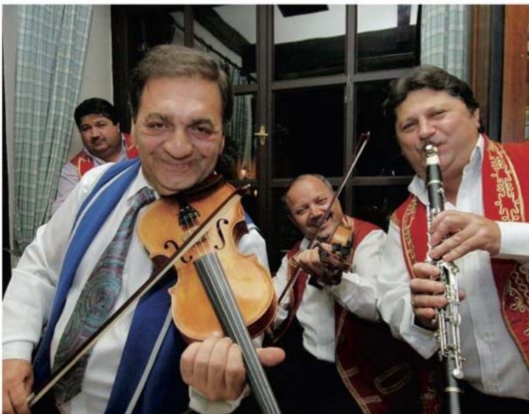
Voor velen hoort dit bij een bezoek aan Hongarije: een folkloristische avond met livemuziek

van jazz, blues, soul en rock zijn nog steeds uitstekend. Het concert begint meestal om 21 uur, na afloop is er disco. De toegang is gratis.