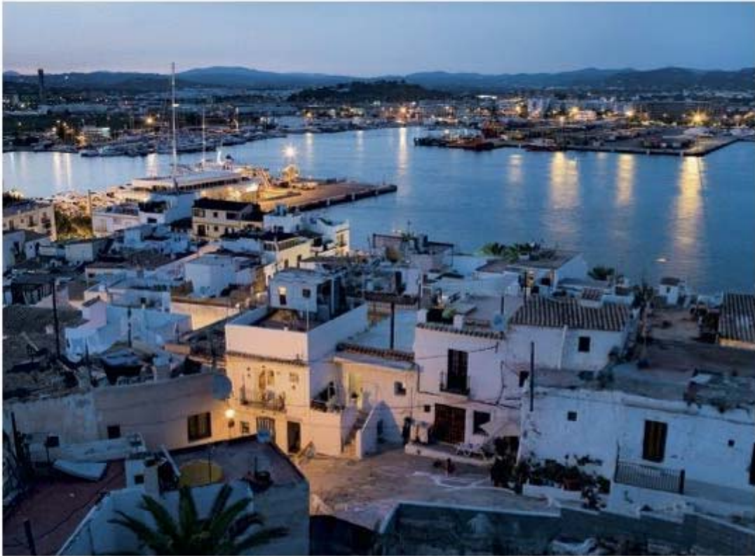
De mooi verlichte haven bij het invallen van de duisternis

vinden processies en andere religieuze ceremonies plaats, op de 6e ter ere van Sant Salvador, de beschermheilige van de haven, en op de 8e ter ere van Sant Ciriac. Op 8 augustus, de dag van de herovering van Eivissa door de Catalanen, beklimmen de stedelingen de Puig des Molins, waar ze de verdrijving van de Moren herdenken.