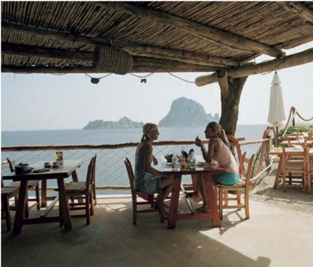
Restaurant Es Boldado aan Cala d'Hort (zie blz. 57) is ideaal voor een pauze

(Spanjaarden drinken het vrijwel helemaal niet). Wie na het eten eens wat anders wil, kan in plaats van een café solo ( café exprés , Spaanse espresso) een café caleta (koffie met alcohol, citroen en suiker) of een café cigaló (koffie geflambeerd met brandy) bestellen. Ook een glaasje hierbas (zie blz. 18) is aan te bevelen, vooral omdat de likeur vaak door de gastheer zelf is bereid.