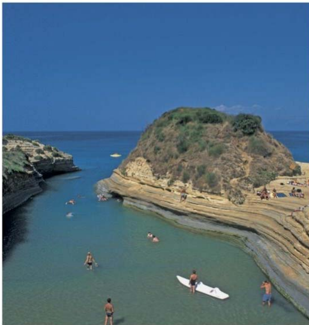
Liefdesverdriet? Een duik in het Canal d'Amour bij Sidári kan misschien helpen