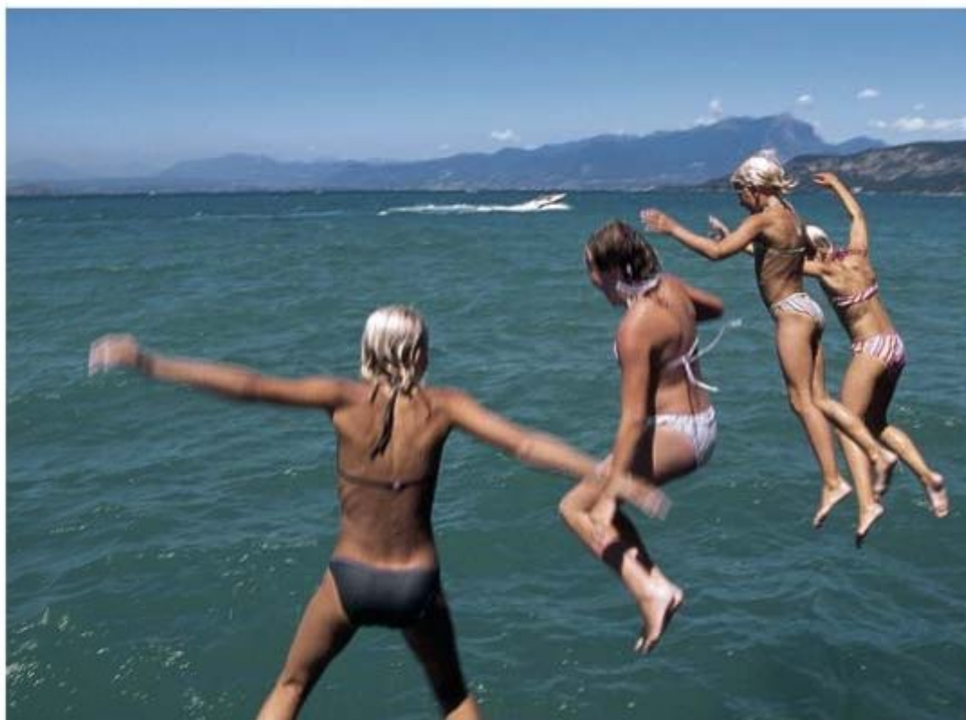
Zomerse waterpret – hiervoor is in en rond het Gardameer voldoende gelegenheid

leven rustig zijn gangetje. Heel anders gaat het er een paar kilometer zuidelijker aan toe, waar aan het meer diverse beroemde attractieparken (► E 11/12) liggen. Peschiera (► D/E 12) ligt op een strategisch belangrijke positie, waarvan de kazernes en vestingsmuren, waar het historische centrum achter verborgen ligt, nog steeds van getuigen. Vanaf hier kunt u de trein naar Verona nemen om daar een dagje rond te wandelen.