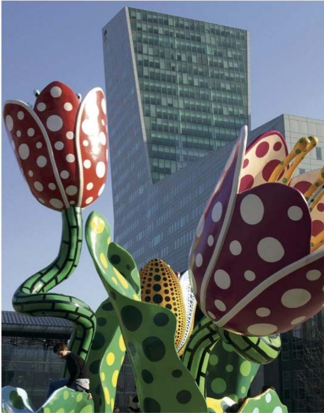
Euralille, Lille, met de reuzentulpen van Yayoi Kusama

een Britse kweker ontwikkeld en met die naam gedoopt. Deze roos is donkerroze tot lichtrood, heeft vijf blaadjes, een uitzonderlijk lang bloeiseizoen en verspreidt een licht parfum. Na de bloei ontstaan er mooie rozenbottels. Deze soort doet het uitstekend in de Abbaye de Valloires, de Abbaye de Chaalis en Château de Rambures. Daar ziet u overigens nog veel meer rozensoorten. Heel veel publiek trekken de rozendagen in Chaalis, half juni. Rozenblaadjes