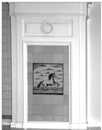
Het schoorsteenstuk met tegeltableau.