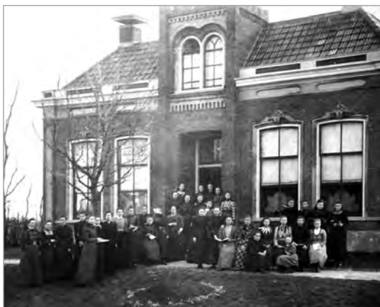
De kostschool te Spannum.