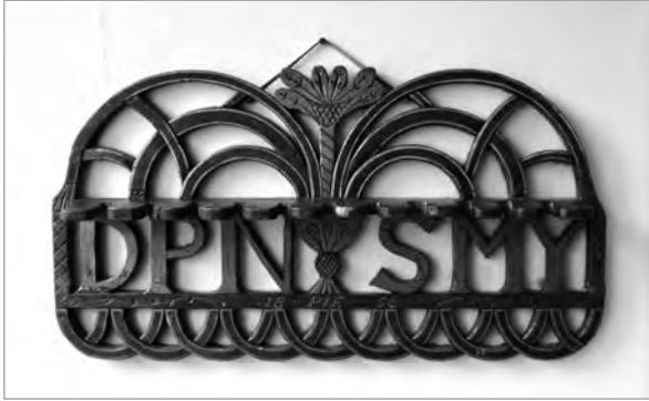
Het pijpenrek met de initialen van het echtpaar Noordmans-Ypma. Mogelijk symboliseert de voorstelling in het midden de uitdrukking 'Palma sub pondere crescit.' / 'De palmbloem groeit tegen de verdrukking in.'

Wel bleef haar bovendeel bevrijd En hoofd en handen als altijd Ten dienste van 't gebruik bewaard, Ook pijn ging er niet mee gepaard.