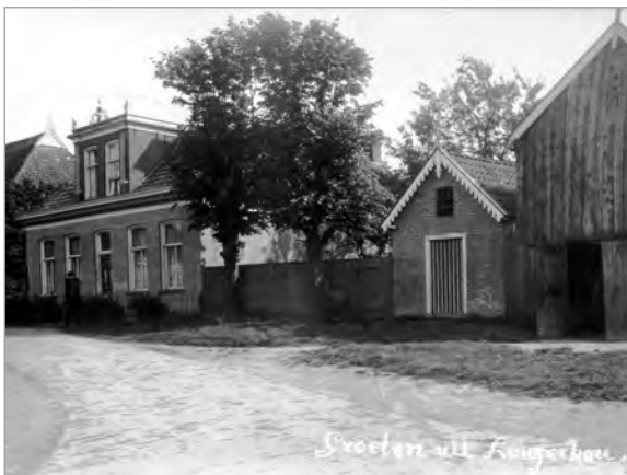
De pastorie te Langerhouw, ca. 1925.