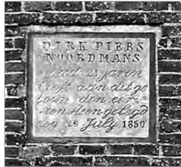
De eerste steen van de Noordmans-boerderij op Tritzum