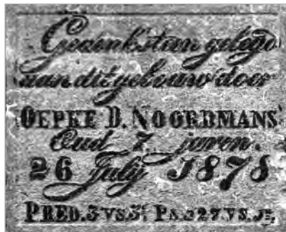
De eerste steen.

De boerderij bestaat nog steeds. De voorname woning beschikt nog over tal van authentieke interieuronderdelen, waaronder een schoorsteenstuk met een voorstelling van het bezoek van de koningin van Scheba aan koning Salomo (met als onderschrift een verwijzing naar 2 Kronieken 9:1) en een schoorsteenstuk met een tegeltafel waarop een paard geschilderd is.