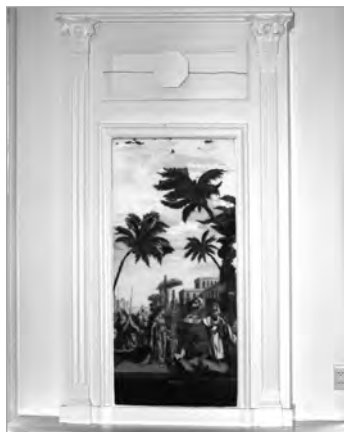
Het schoorsteenstuk met schilderij, 2021.