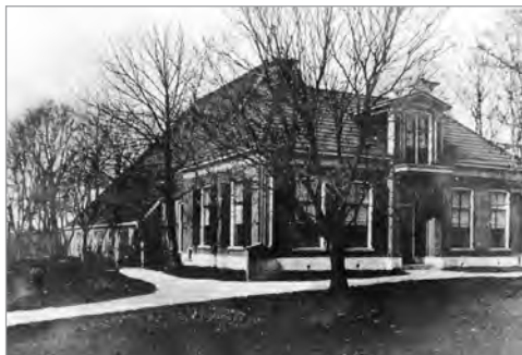
De Noordmans-boerderij, Legedyk 2 te Scharnegoutum

Vanaf 1879 vestigde het gezin Noordmans-de Roos zich nabij Scharnegoutum. Ze betrokken toen een nieuwe boerderij aan de Legedyk, nummer 2. De eerste steen daarvan is op 26 juli 1878 door 'Oepke D. Noordmans' gelegd.