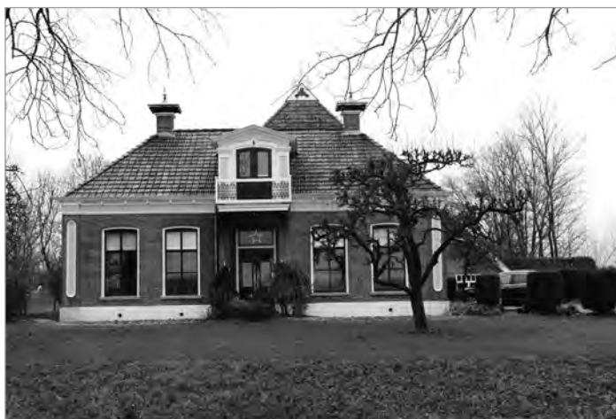
De boerderij aan de Legedyk 2 te Scharnegoutum, 2021.

De boerderij bestaat nog steeds. De voorname woning beschikt nog over tal van authentieke interieuronderdelen, waaronder een schoorsteenstuk met een voorstelling van het bezoek van de koningin van Scheba aan koning Salomo (met als onderschrift een verwijzing naar 2 Kronieken 9:1) en een schoorsteenstuk met een tegeltafel waarop een paard geschilderd is.