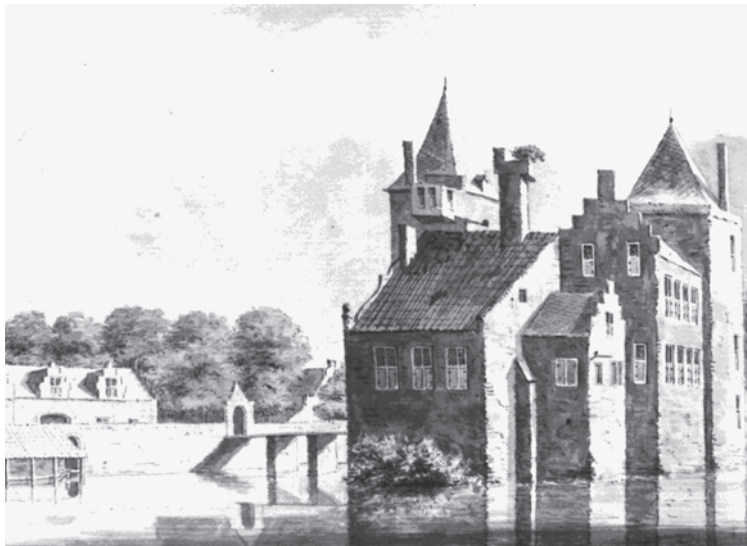
Huis Amerongen anno 1646

enkele bescherming meer boden. Niemand maakte zich daarover zorgen, het nut van het kasteel lag op een ander vlak. Wie toegang wilde hebben tot de ridderschap van Utrecht moest naast een riddermatige afkomst en een stevig financieel vermogen in het bezit zijn van een erkende hofstede. In Utrecht stonden drieënzestig hofsteden, Huis