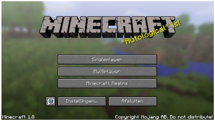
Figuur 1.2: Het hoofdmenu

In de volgende opsomming zie je wat je kunt doen, nadat je op een van de knoppen van het hoofdmenu hebt geklikt: