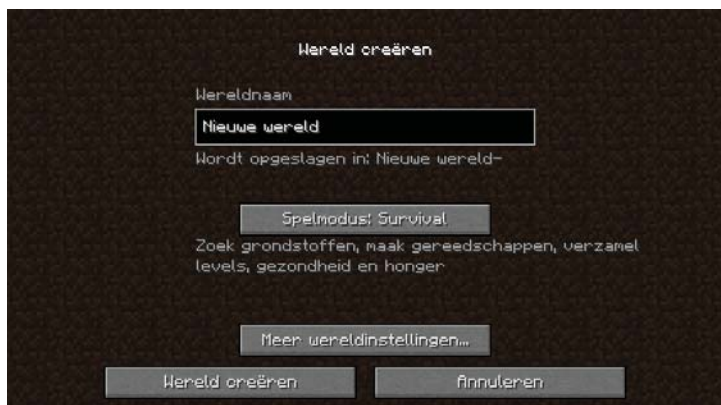
Figuur 1.3: Een nieuwe wereld maken