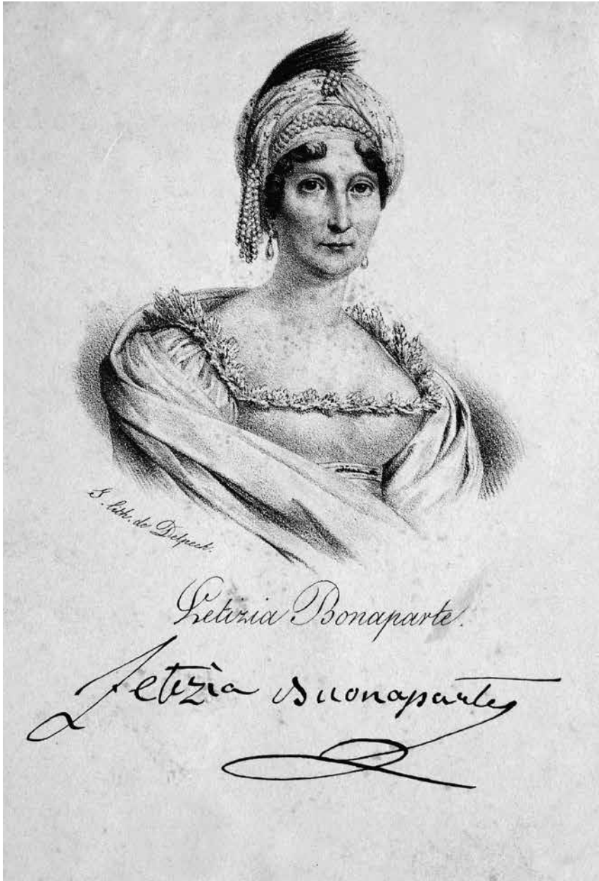
Marie Letizia Ramolino trouwde in 1764 op veertienjarige leeftijd met Carlo Maria Buonaparte. Vijf jaar later werd hun zoon Napoleon geboren. (steendruk op papier door François-Séraphin Delpech, ca. 1820)