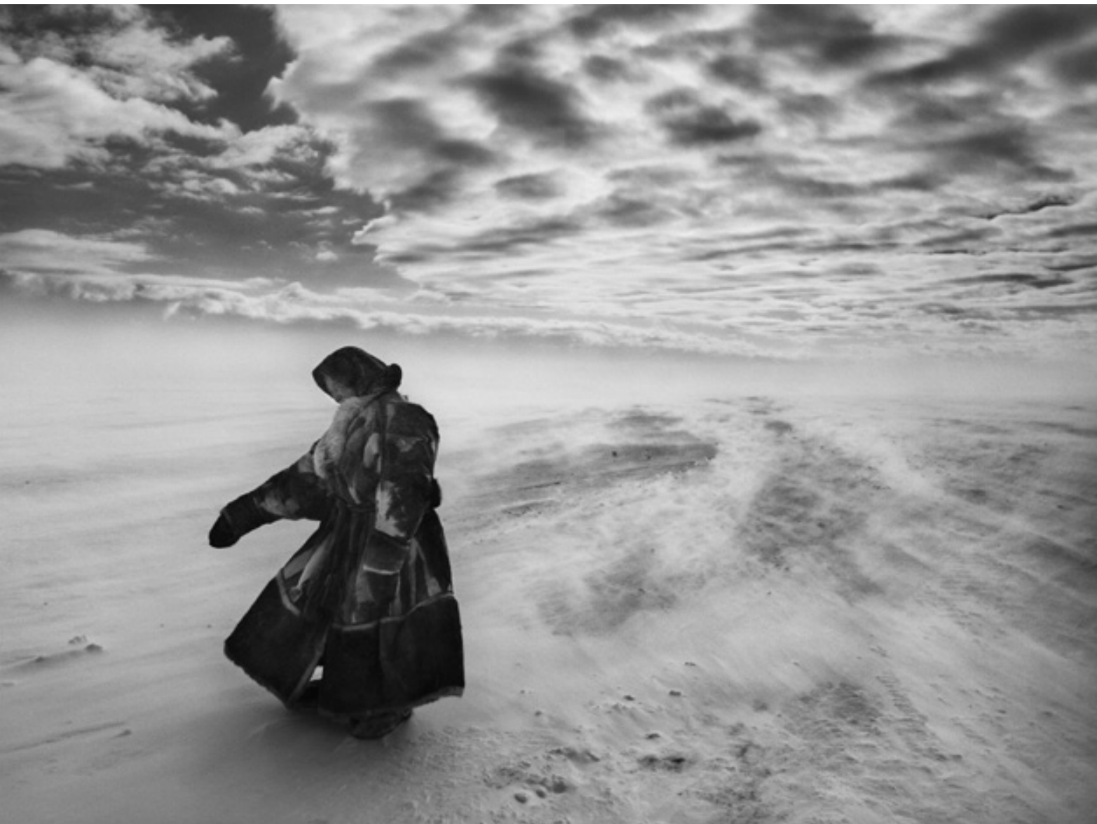
The Salt of the Earth. Still uit de film de gelijknamige film van Wim Wenders en Juliano Ribeiro Salgado, 2014

Het lucide denken van Jan van Rijckenborgh en zijn grote menselijkheid brachten hem ertoe samen met Catharose de Petri een moderne school te stichten voor de ontwikkeling van het bewustzijn, het Lectorium Rosicrucianum. Zij deden dit vanuit de gedachte dat het opheffen van het gebrek aan kennis over de achtergronden van het bestaan de sleutel is tot het opheffen van het wereldleed.