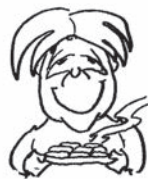
DORA* *GEEN SUPERSCHURK

Mijn ouders zijn niet zulke belangrijke superschurken en bovendien zo'n beetje met pensi-