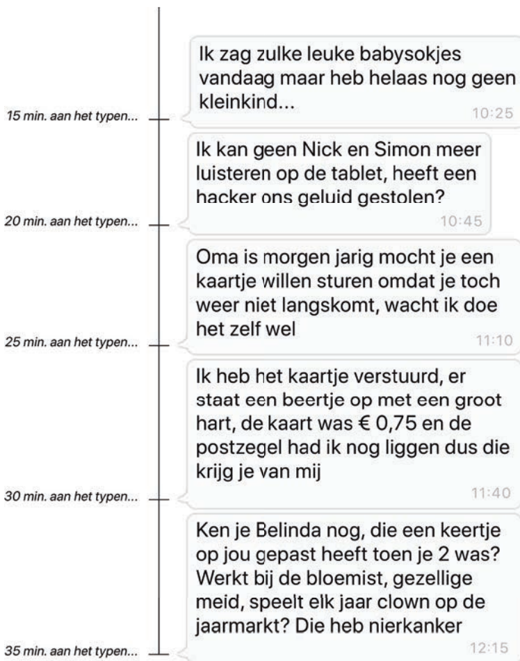
Figuur 2: De betekenis van het mysterieus langdurige 'aan het typen...' van moeders, gerangschikt op tijdsduur