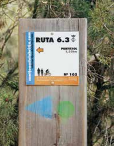
Maar weinig routes zijn gemarkeerd.

Maar weinig routes zijn gemarkeerd. Soms wordt dus bij het vinden van het pad een beetje padvindersspuurwerk gevraagd. Geheel betrouwbaar functioneren echter de huidige 'wegwijzers', de GPS-tracks, die het vinden van de routes op Ibiza aanzienlijk vereenvoudigen.