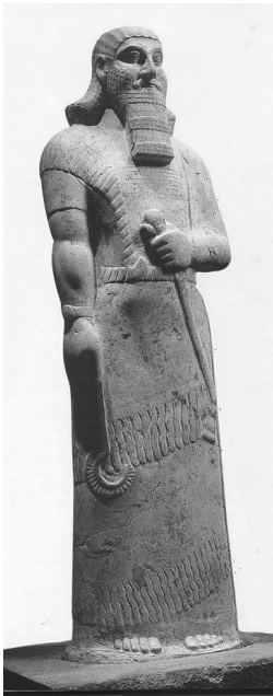
Afbeelding 2.1: Een beeld van Ashurbanipal, de laatste grote heerser van het Nieuw-Assyrische rijk.

Met de uitvinding van het schrift vond de mensheid niet alleen de bureaucratie uit maar ook de grootschalige opslag van gegevens. Zo is een groot deel van onze kennis van het Nieuw-Assyrische rijk (negende tot zevende eeuw voor onze jaartelling) gebaseerd op gegevens uit het Koninklijke archief van Ashurbanipal (685 BCE tot 627 BCE, afbeelding 2.1). Op zijn hoogtepunt heeft deze bibliotheek meer dan 30.000 documenten en voor het beheer waren geen computers met een data-