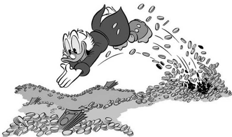
Afbeelding 1.1: Dagobert Duck die liever zwemt in zijn geld dan dat hij het nuttig gebruikt.

Om de (verborgen) informatie uit Big Data te halen wordt een hele serie gereedschappen aangeboden, die allemaal zonder uitzondering volgens de leverancier de allerbeste zijn. De vraag blijft wel, welke van het aangeboden gereedschap voor uw bedrijf en voor uw toepassing nu echt het