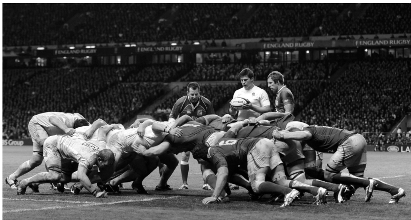
Afbeelding 1.2: De optimale vorm van 'teamwork' op het rugbyveld, de scrum.

Iedereen die werkt met Big Data heeft, ongeacht zijn of haar positie binnen het proces, een goede basiskennis nodig. Juist die gemeenschappelijke basiskennis maakt een goede en zinvolle communicatie tussen de verschillende betrokkenen mogelijk en zorgt voor 'teamwork' (afbeelding 1.2).