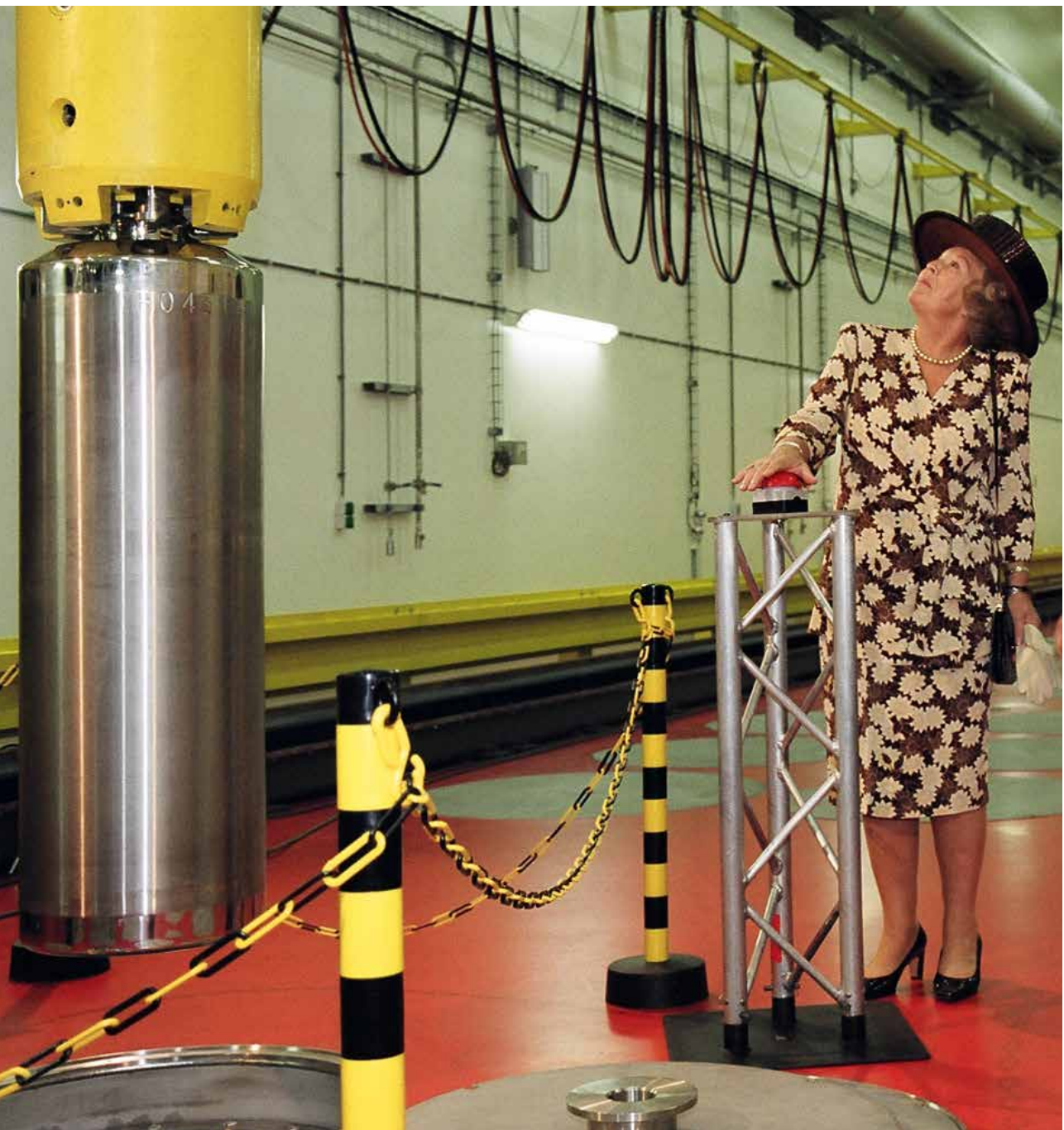
Koningin Beatrix neemt een depot van de Centrale Organisatie Voor Radioactief Afval (COVRA) te Vlissingen op 30 september 2003 in gebruik. Radioactief afval is in feite nationaal erfgoed.